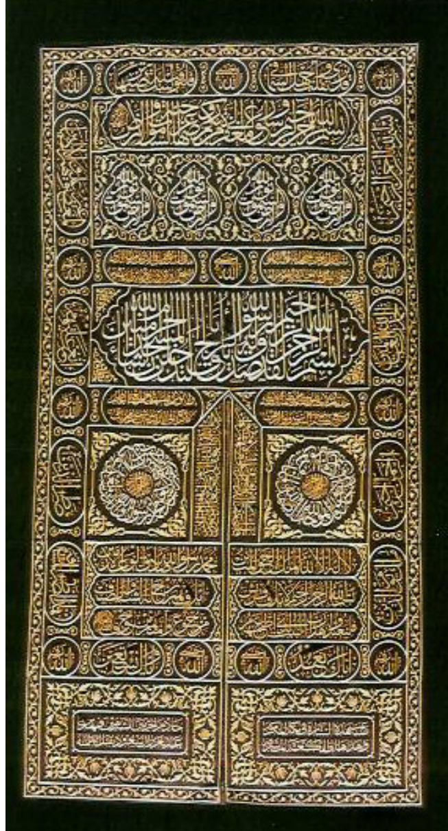
صورة تمثل ستارة باب الكعبة المشرفة