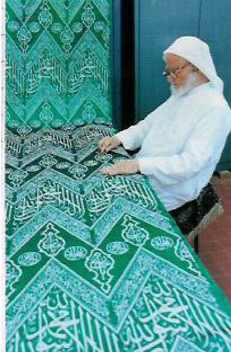
الكسوة الداخلية للكعبة المشرفة